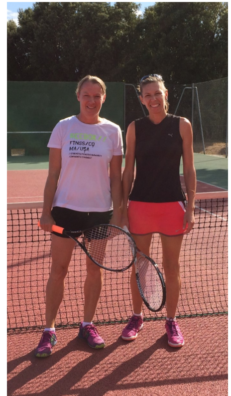
Finalistes du Tournoi Interne

Le Tennis Club Saint Bauzille de Montmel, c'est aussi des animations tout au long de l'année, alors n'hésitez pas à nous rejoindre !