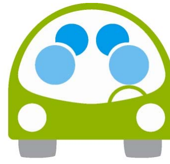
Aide au transport pour les sinistrés