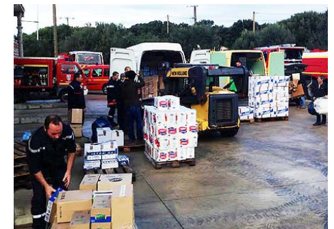
Logistique des dons