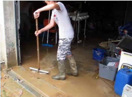
Aide au nettoyage