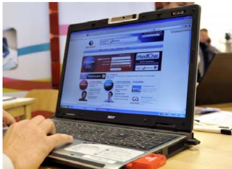
Mise à disposition informatique et téléphonique