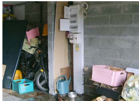
Electricité : consignes de sécurité